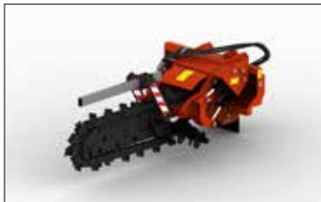
ST120H MODULO CATENA