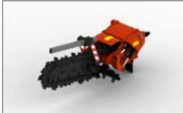
CT120H MODULO CATENA