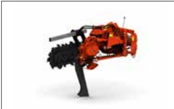
PT120H COMBO INTERRATRICE/ SCAVATRICE